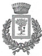
COMUNE DI BUONVICINO